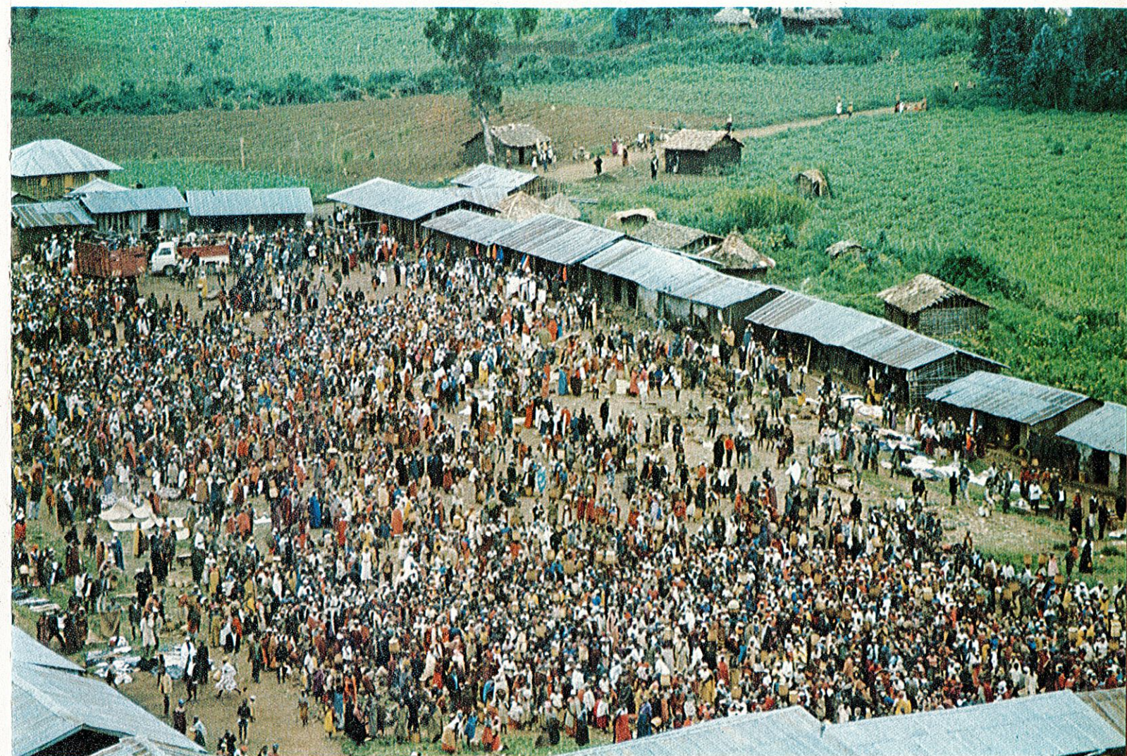
Marché de Busasa.