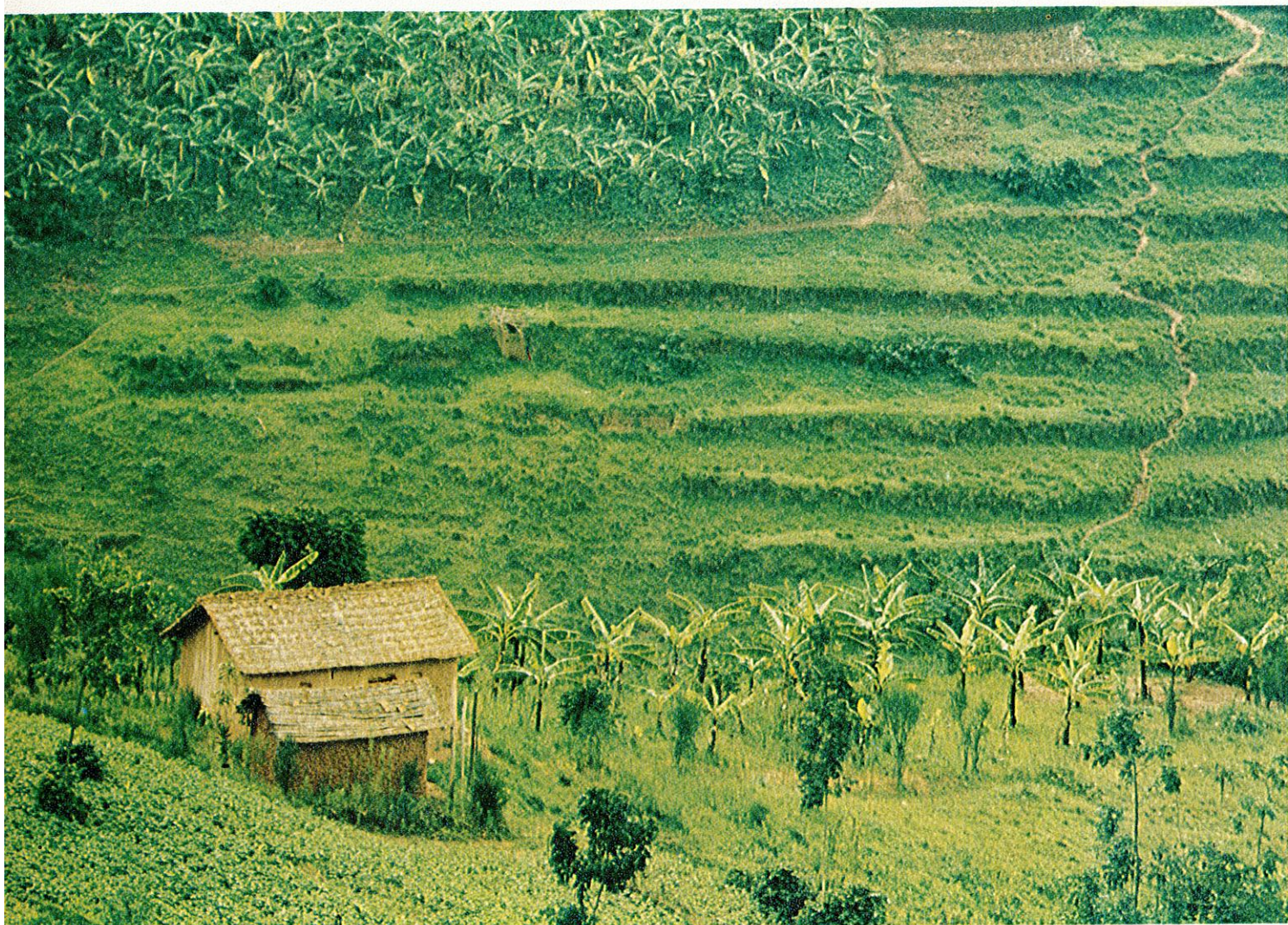
Paysage et case typiques du Rwanda.